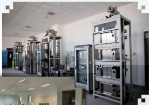
智能电梯安装调试 维护训练场所